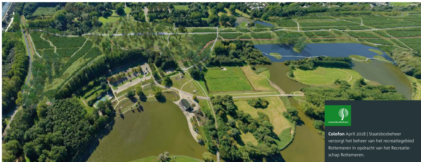
De A16 Rotterdam in het Lage Bergse Bos

"Het schap grijpt de komst van de A16 Rotterdam aan om het Lage Bergse Bos mooier en aantrekkelijker te maken"