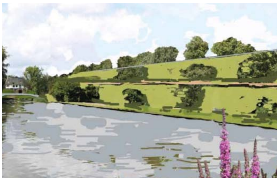
Talud A16 Rotterdam in het Lage Bergse Bos