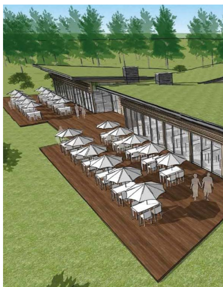
Lake House Rotterdam

"Het schap grijpt de komst van de A16 Rotterdam aan om het Lage Bergse Bos mooier en aantrekkelijker te maken"